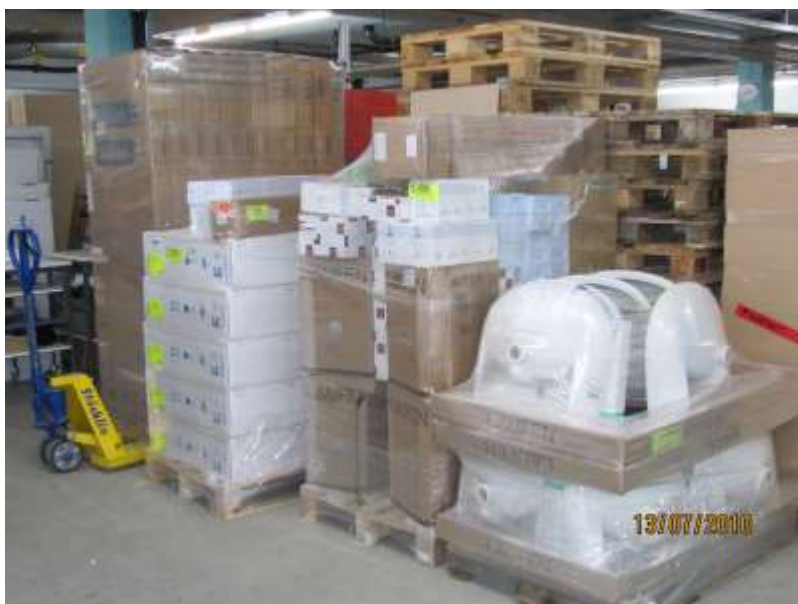
Vorfabrizierte GIS-Rahmen mit eingebautem Geberit-UP-Spülkasten, Abstellventilen und Mepla-Rohren.