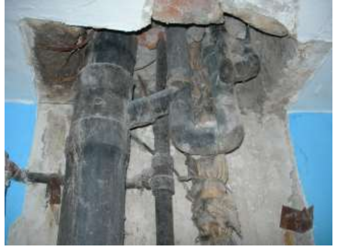
Interessante rumänische Ablauflösungen.