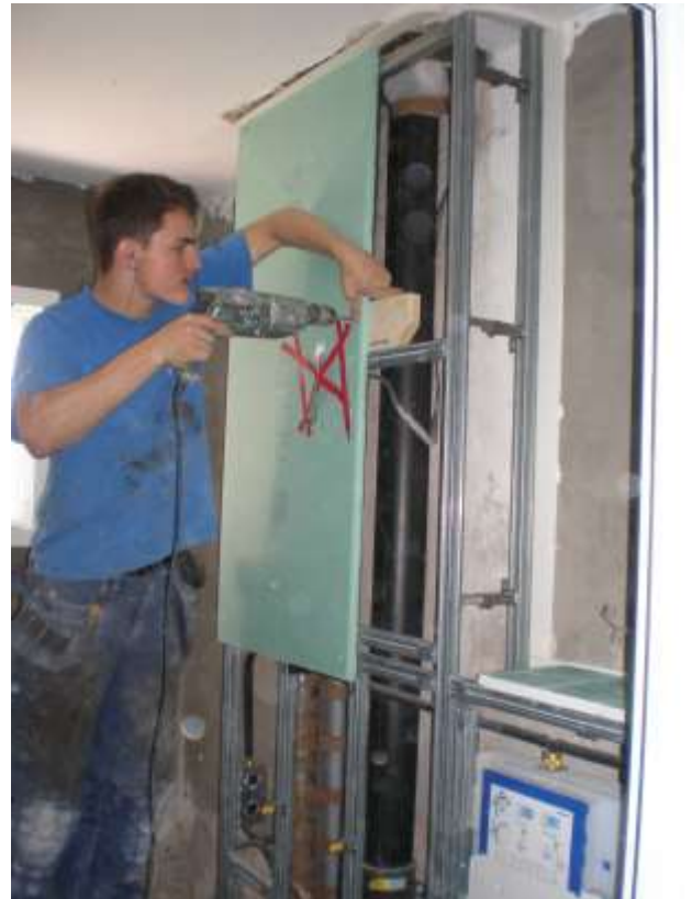
Zur Befestigung der Spiegelschränke braucht es Verstärkungen hinter den GIS-Paneelen.