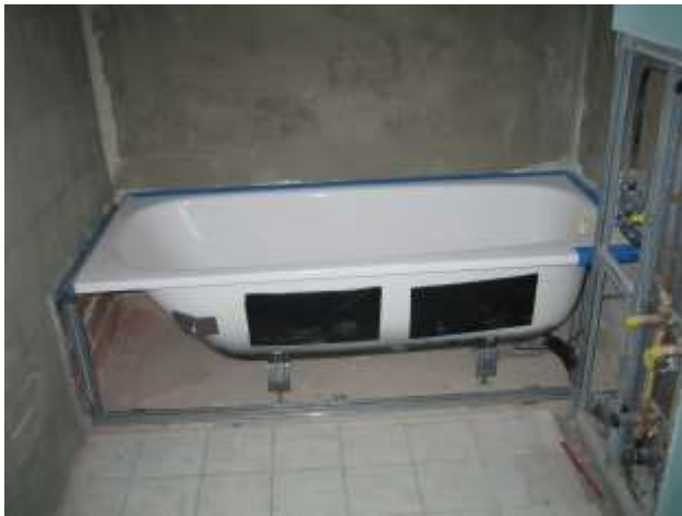
Die Schmidlin-Stahlbadewannen sind gesetzt, angeschlossen, kontrolliert und das „Skelett“ für die Wannenschürze montiert.