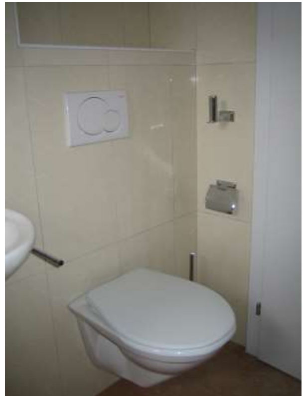
Detailansichten mit UP-Wohnungsabstellung, Wandklosett mit UP-Spülkasten und Garnituren.