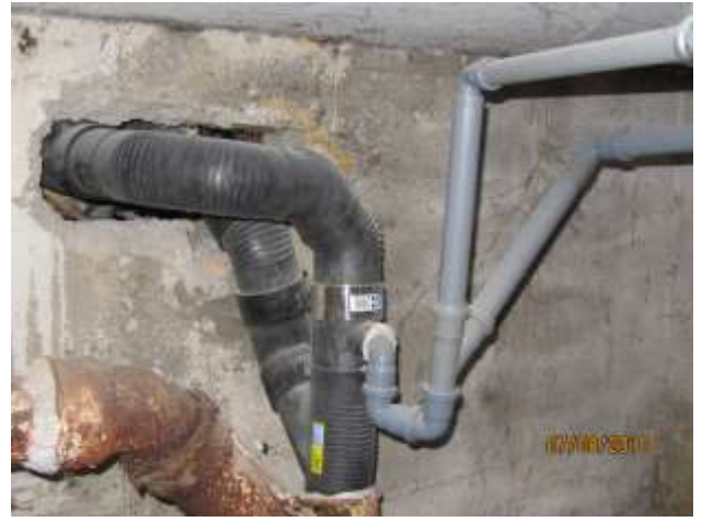
Anschluss der Umgehungsleitung an die bestehenden Gussrohre mit Verbindung der rumänischen PVC-Laborleitungen.