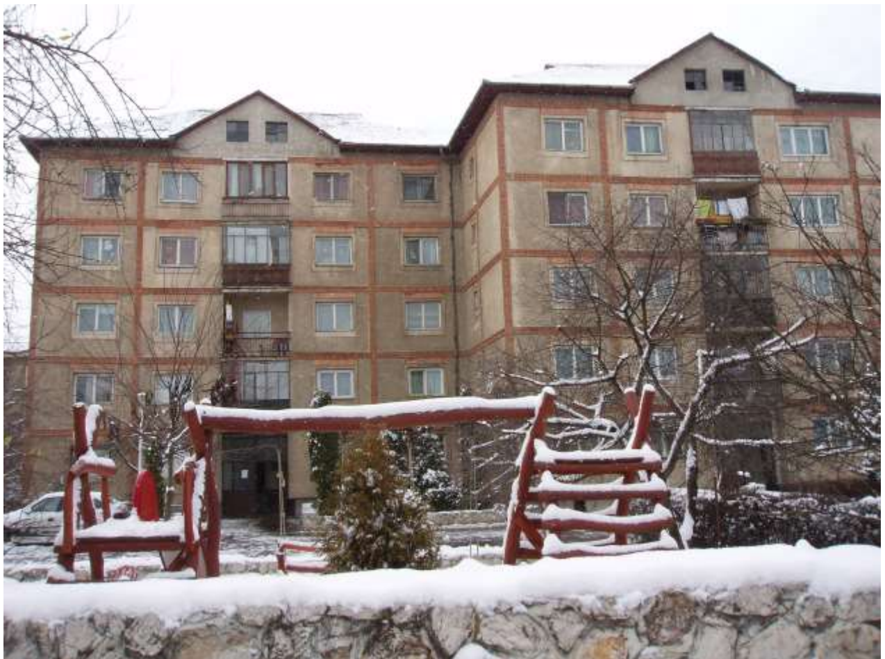
Wohnungen für 200 Kinder in Deva. Im linken Block werden die Badezimmer total renoviert.