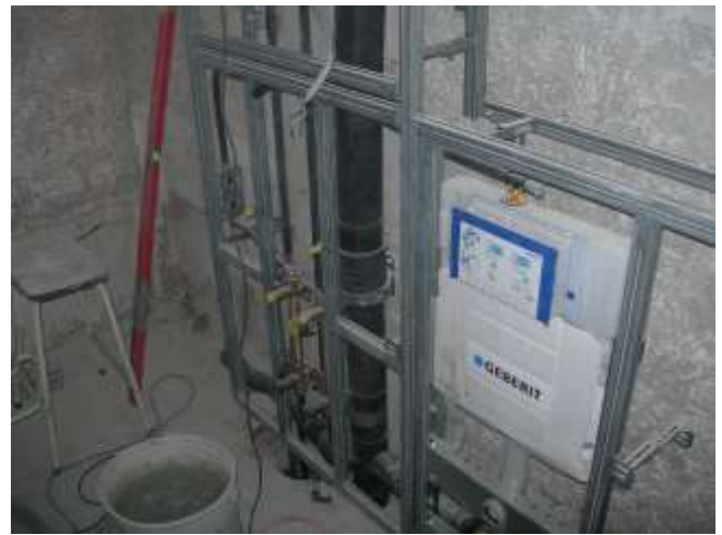
Einbau der vorfabrizierten GIS-Elemente und verbinden der Wasser- und Ableitungen.