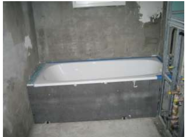
Auf die Wediplatte können die Keramikplatten dann aufgeklebt werden.