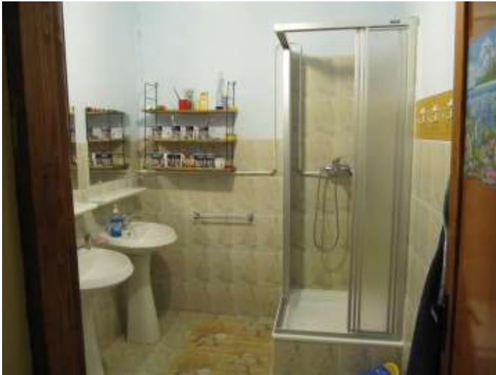
Neu montierte Trennwände, Tablare, Duschengleitstangen und weitere Garnituren