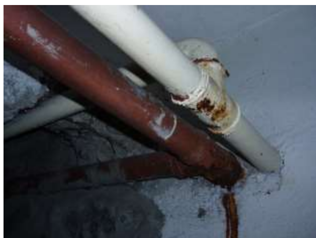
Undichte, durchgerostete Wasserleitungen.