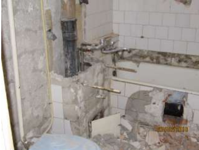
Abbruch der alten Bäder, verbunden mit viel Staub.

lotterigen Türen und Fenster sind vorsichtig von den dünnen Wänden zu lösen. Gleichzeitig wird sofort mit dem Verputzen der krummen Wände begonnen. Gar nicht so einfach, eine gerade Fläche hinzukriegen. Aber Übung macht den Meister!