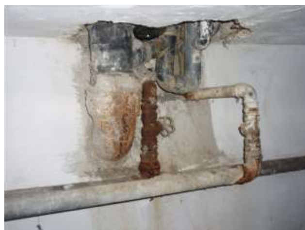
Alle diese Leitungen im Keller werden ersetzt.