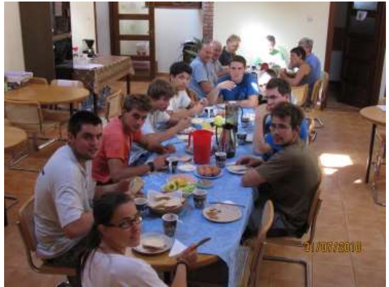
Ein einfaches, aber nahrhaftes Essen hilft die Kräfte für den anstrengenden Arbeitstag wieder aufzutanken. En Guete!