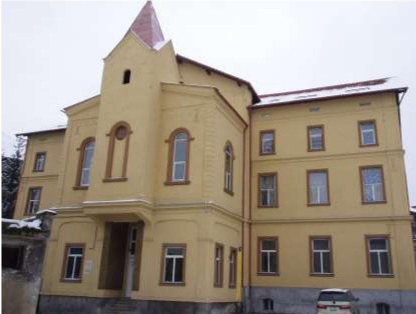
Das vor sechs Jahren renovierte Kinderheim in Petrosani.