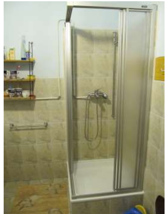
Unkonventionelle Umfahrung der Trennwand mit der Wasserleitung. Dafür trockene Badezimmer !