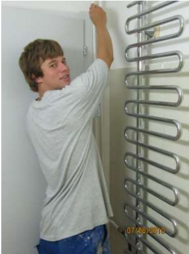
Die Heizungsleitungen bekommen einem neuen Anstrich, damit sie zu den tollen Handtuch-Radiatoren passen.