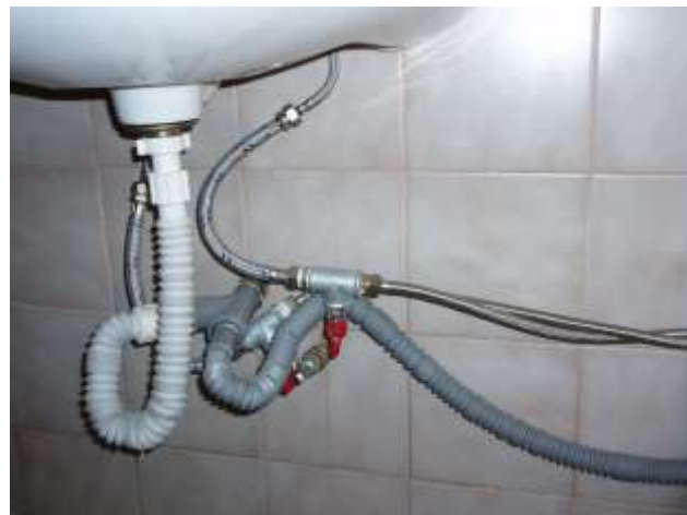
Sanitärinstallation à la Romania.