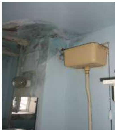
Überall nasse Decken

Kinderheim zu helfen. Dabei standen wieder besonders die Anliegen der Kinder und Jugendlichen im Vordergrund. Der Zustand der sanitären Einrichtungen ist auch hier in einem katastrophalen Zustand.