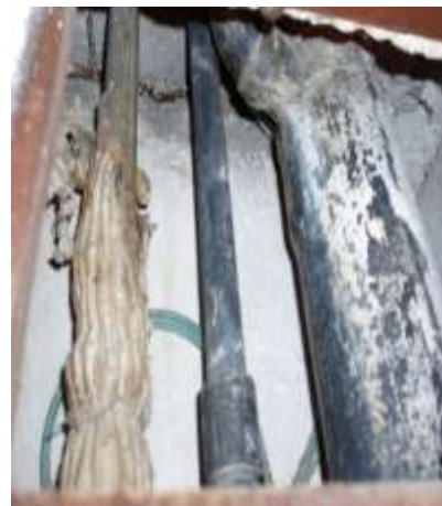
PVC – Leitungen im Schacht