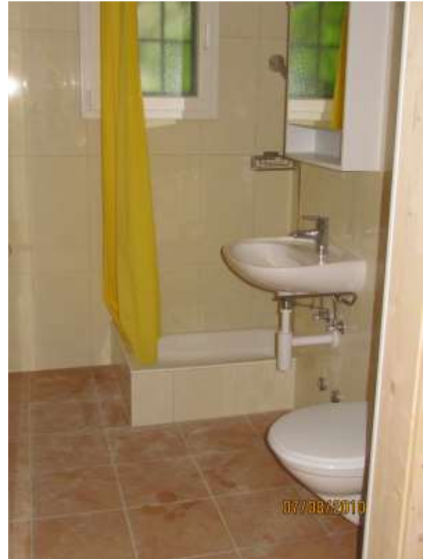
Im EG wurde auf Wunsch eine Dusche eingebaut.