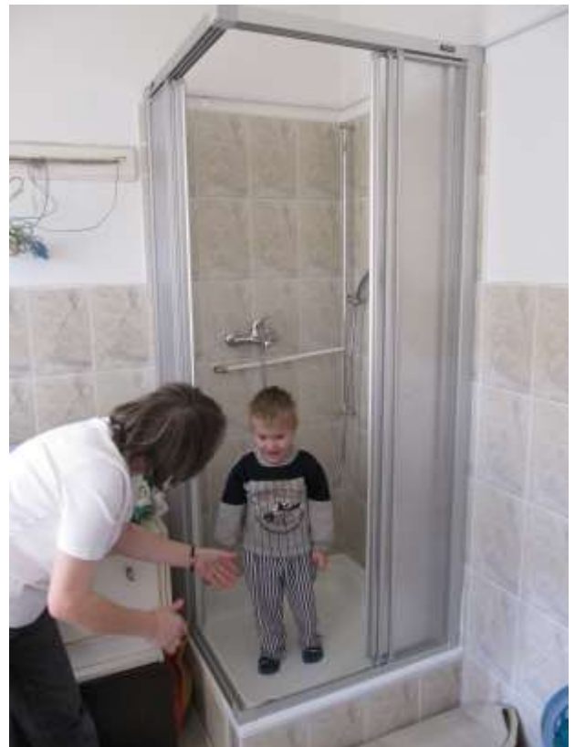
Die Freude des Kleinen in der neuen Dusche scheint nicht so gross zu sein