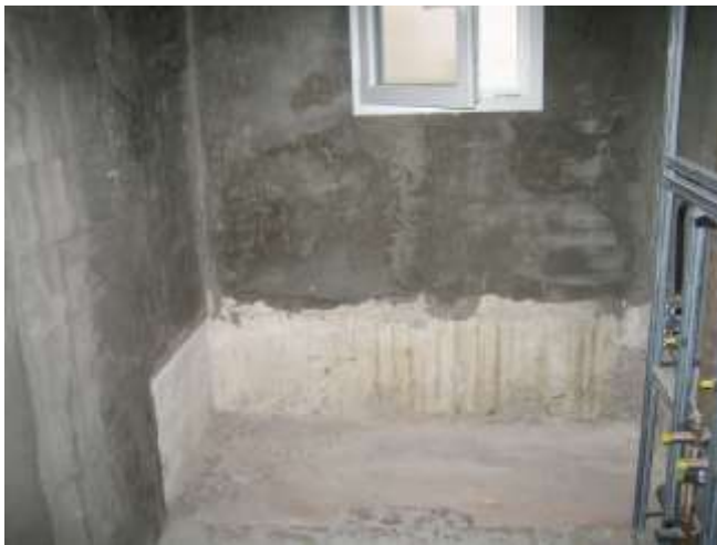
Neu verputzte Wände und neue Isolierglas-Fenster