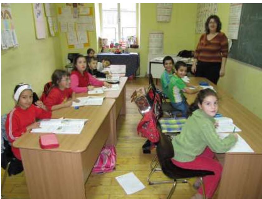
Aufmerksame, fleissige ABC-Schützen in einem Schulzimmer.