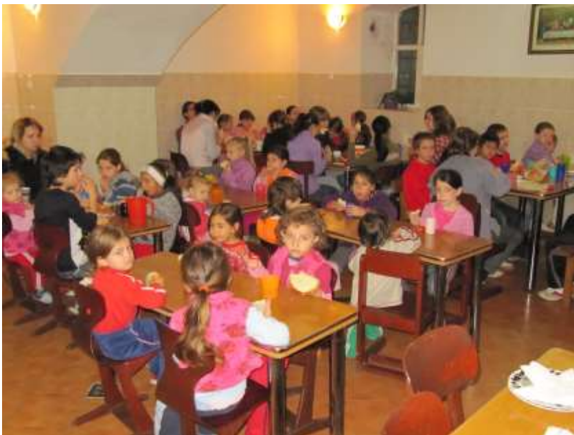
Eine Gruppe von Kindern mit ihren Betreuerinnen im Speisesaal beim Morgenessen