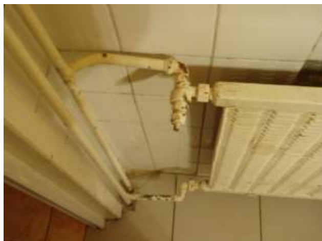
Radiatoren und Heizungs-Ventile von vorgestern.