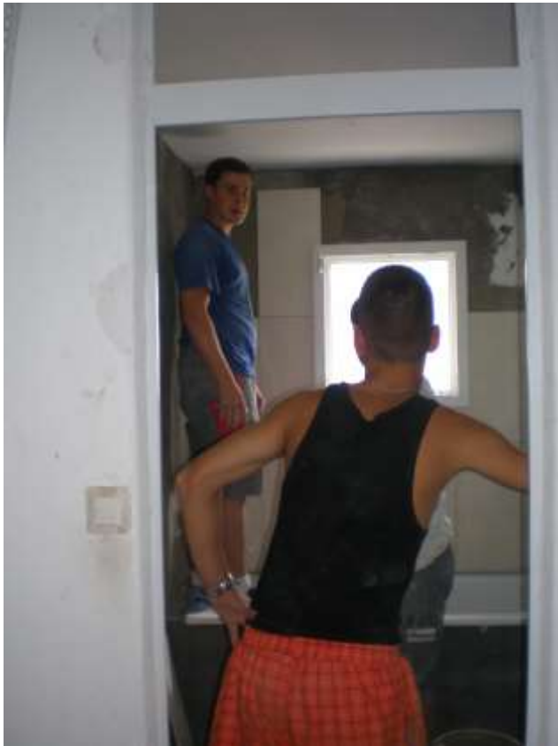
Erfahrungsaustausch unter den Lehrlingen.